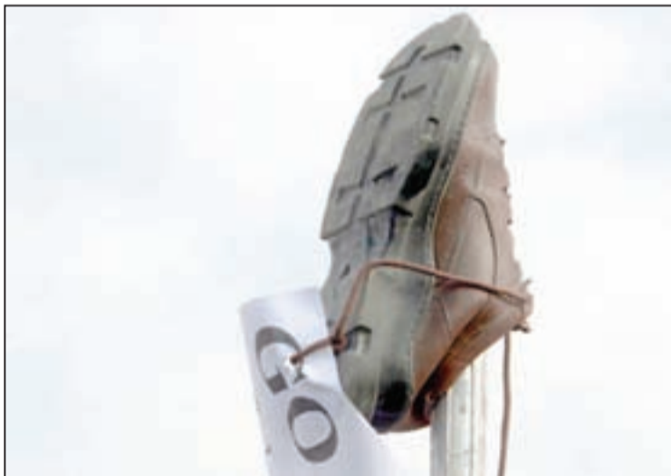
Señal di protesta contra e bishita di presidente Bush na Irak

MUNDO Arabe ayera tabata puro elogio pa e reportero Iraki cu a manda su zapatonan riba presidente George W. Bush como señal di desprecio, y na Irak miles di hende a sali riba caya pa exige libertad di e periodista, cu nan a califica como un heroe.